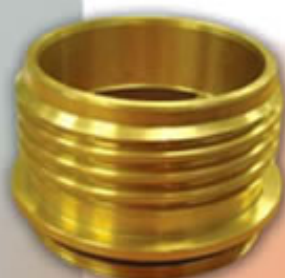
RACOR BOMBERO RL100RB