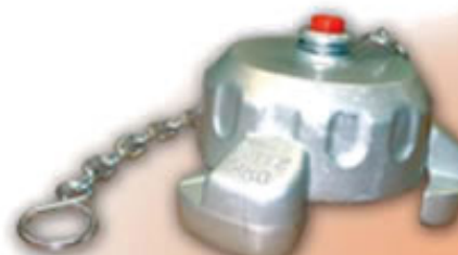
TAPON RACOR 70 TPE70