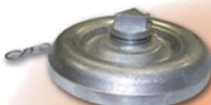
TAPON RACOR STORZ ANTIRROBO 110 RSTTPA110