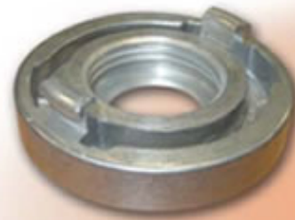
RACOR STORZ 75 RSTRE7212