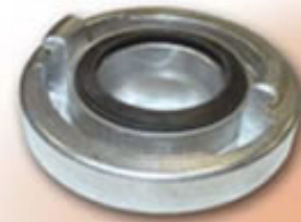
RACOR STORZ 52 RSTRE5112