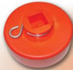
TAPON ANTIRROBO FIBRA RACOR 45 TPAF45