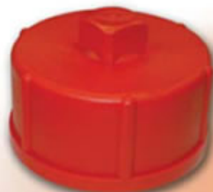
TAPON ANTIRROBO FIBRA BOMBERO TPAF100