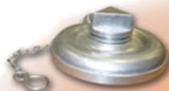
TAPON RACOR STORZ ANTIRROBO 52 RSTTPA52