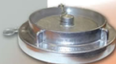
TAPON RACOR STORZ 110 RSTTP100