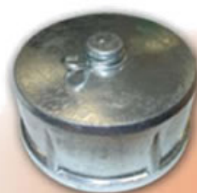
TAPON RACOR BOMBERO TP100