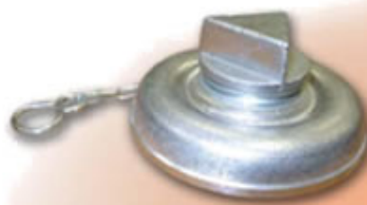
TAPON RACOR STORZ ANTIRROBO 75 RSTTPA75