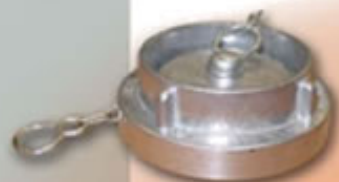
TAPON RACOR STORZ 52 RSTTP52