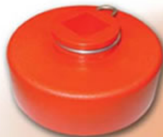
TAPON ANTIRROBO FIBRA RACOR 70 TPAF70