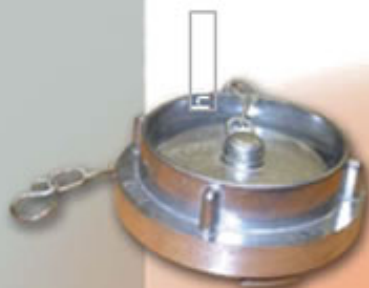
TAPON RACOR STORZ 75 RSTTP75