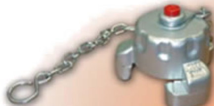
TAPON RACOR 45 TPE45