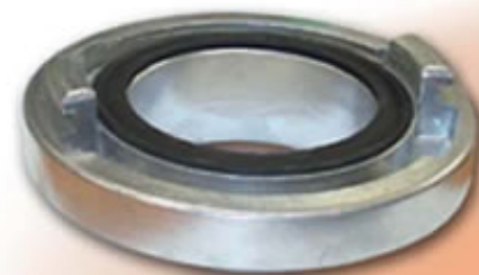
RACOR STORZ 110 RSTRE1004