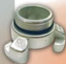
RACOR 45 AFREE45